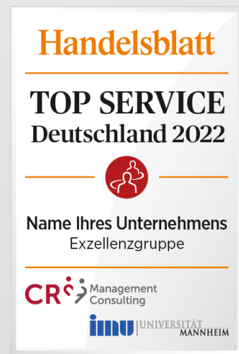
TOP SERVICE Siegel