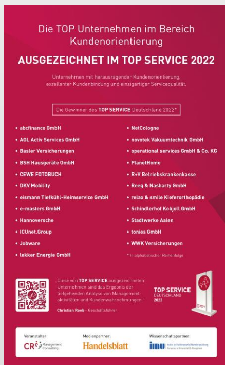
Handelsblatt Anzeige 2022

Neben der fundierten Status Quo Analyse, machen wir bisherige Erfolge sichtbar und veröffentlichen TOP SERVICE Unternehmen im Handelsblatt. Dabei differenzieren wir uns mit dem TOP SERVICE -Logo und -Siegel von anderen Anbietern durch eine langjährige Historie (17 Jahre) und umfassende Erhebungen.