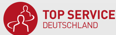
TOP SERVICE Logo